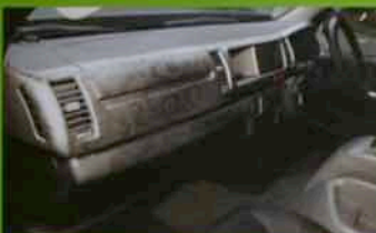
コブラ柄を意識したデザインのインパネはイージーグリップラック処理。価格は12万円。