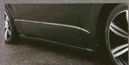
ボディサイドの純正プレスラインとのバランス感が良い薄型形状のサイドステップ。サイドビューのオシャレ感をさりげなくアピール。