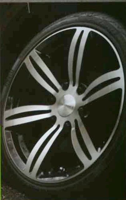
オリジナルホイールのパッドロック。カラーはブラボリ、ブラック、シルバーポリッシュの3色。16インチと18インチをラインアップ。センターキャップには415COBRAロゴが刻印される。価格は4本セット・8万4000円。