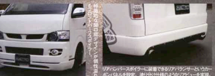
リアハーフスポイラーに装着できるリアバランスというカーボンパネルを設定。塗り分け仕様のようなリアビューを実現。