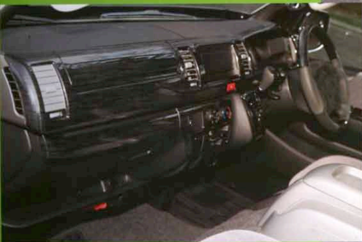
インパネ12点、純正エアバッグ対応交換型ステアリング、シフトノブという3点セットで総お得な4万7250円は見逃せない(個数限定)。カラーはマホガニーウッドとブラックマーブルの2色から選べる。