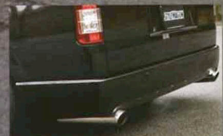
出口径100mmのエコドルフィンマフラー。片側出し(3万7800円〜)と左右出し(7万5600円〜)を設定。足長に見える砲弾テールが薄型エアロにベストマッチ。