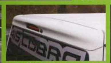
さりげない厚みのデザインで、オシャレなリアビューを演出するルーフトラック。ちょっとしたアクセントとして設置。